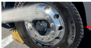
▲ホコリ・汚れ等を綺麗に洗い流す ※濡れたままでも施工できます。