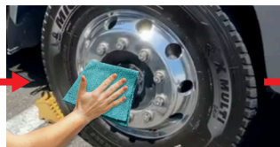
▲拭取りクロスで仕上げる