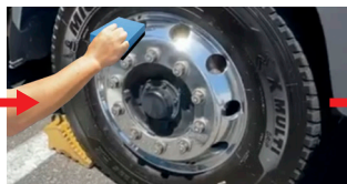
▲専用スポンジに2~3滴取り、磨く ※蓋を押さえながらカラカラ音が鳴るまで ボトルをよく振って混ぜてください。