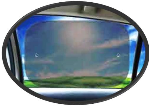
サイドウインドに！