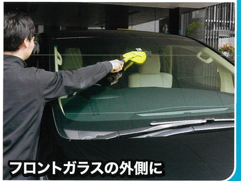
フロントガラスの外側