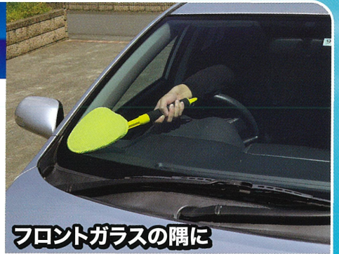
フロントガラスの内側