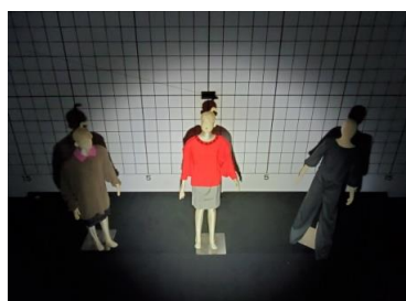
※2mの高さから斜め45度下方向に照射した際の見え方です。