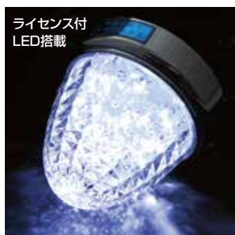
LSL-206W レンズ クリアー 発光色 ホワイト