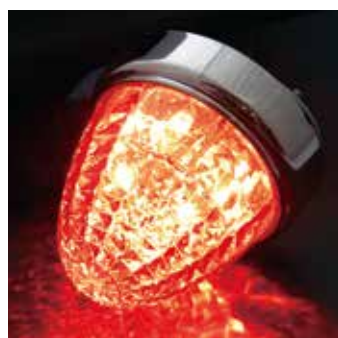
LSL-203R レンズ レッド 発光色 レッド