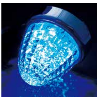
LSL-205B レンズ クリアー 発光色 ブルー