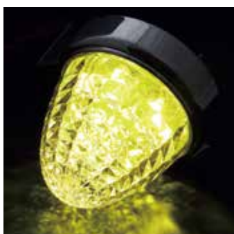
LSL-201Y レンズ イエロー 発光色 イエロー