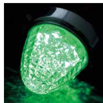
LSL-204G レンズ クリアー 発光色 グリーン