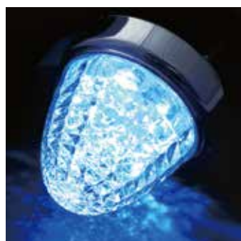
LSL-207CRB レンズ クリアー 発光色 クリスタルブルー